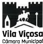
Tabela de Taxas e Licenças.-----

Processo 2316/2026. Município do Alandroal - Pedido de cedência de Autocarro para deslocação das Escolinhas do Benfica a Lisboa (Estádio da Luz), no âmbito do 19.º Encontro Nacional de Escolas do Benfica. Autorizar a cedência gratuita do autocarro, solicitado pelo Município de Alandroal no dia 16/05/2026, para participação no 19.º Encontro Nacional de Escolas do Benfica, de acordo com o descrito na Proposta de Resolução n.º 2656/2026.-----