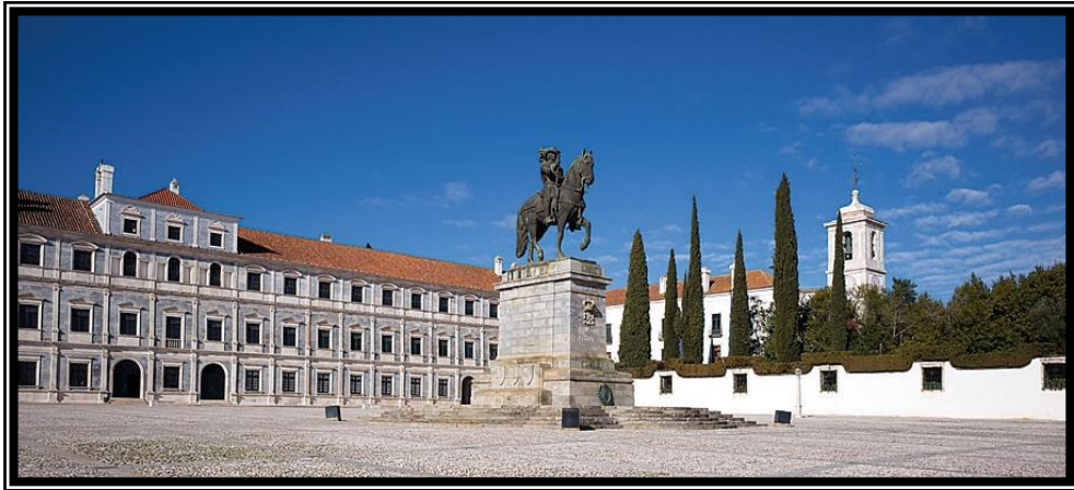
Paço Ducal de Vila Viçosa, vendo-se em primeiro plano a estátua equestre de D. João IV.