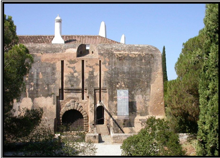
Castelo artilheiro, vista da porta principal.