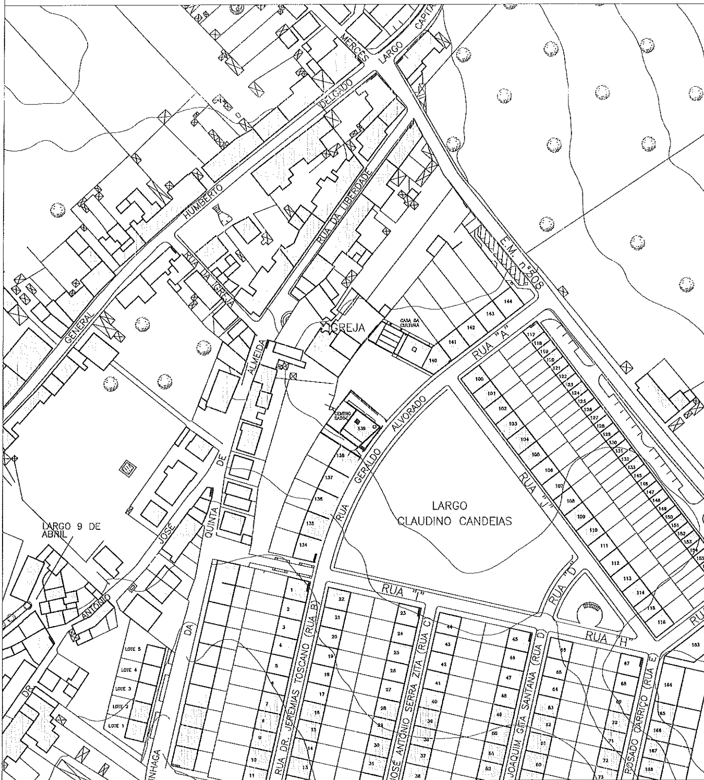
Planta de Localização Esc. 1/2000