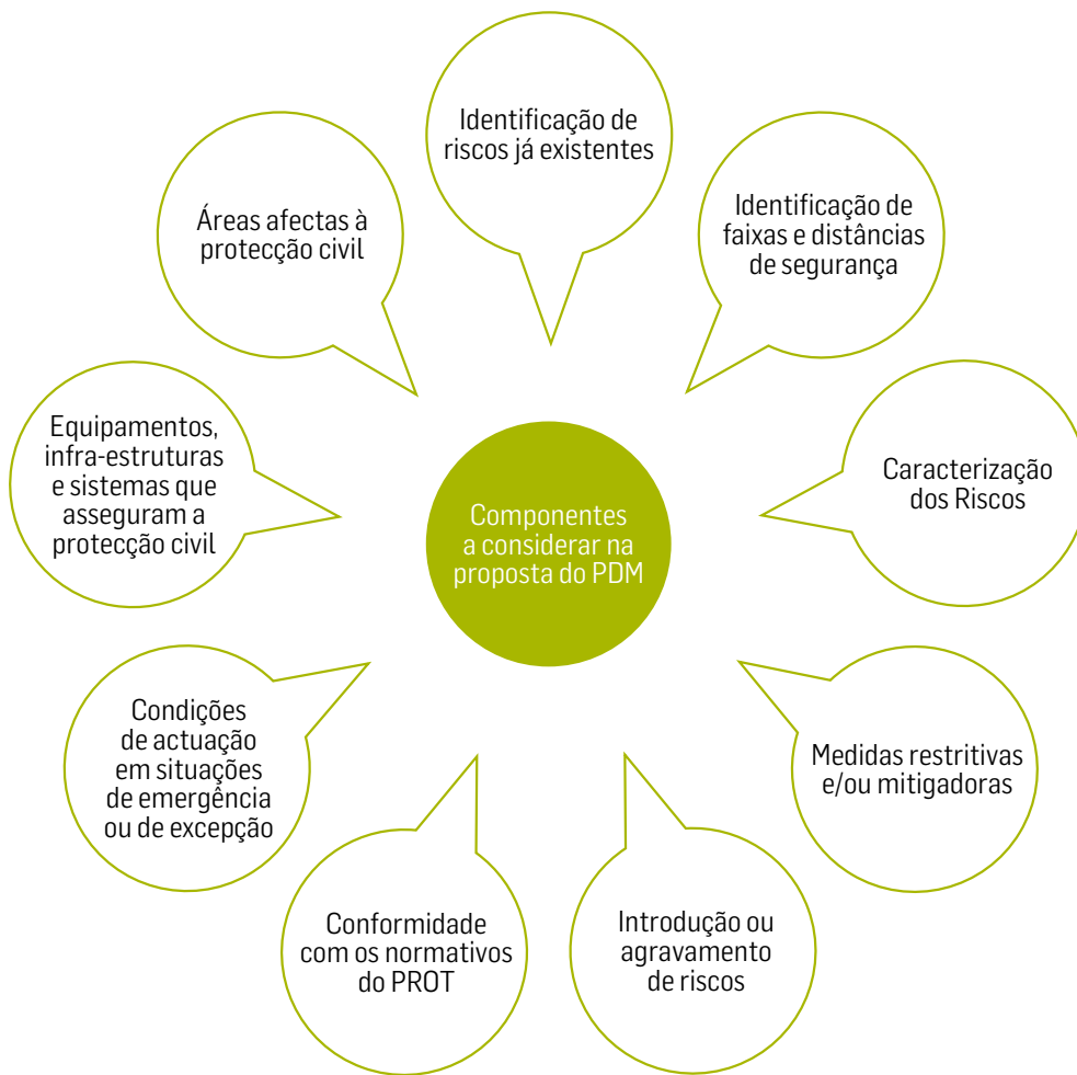
Figura 1 - Factores a ter em consideração na elaboração e revisão de um PDM